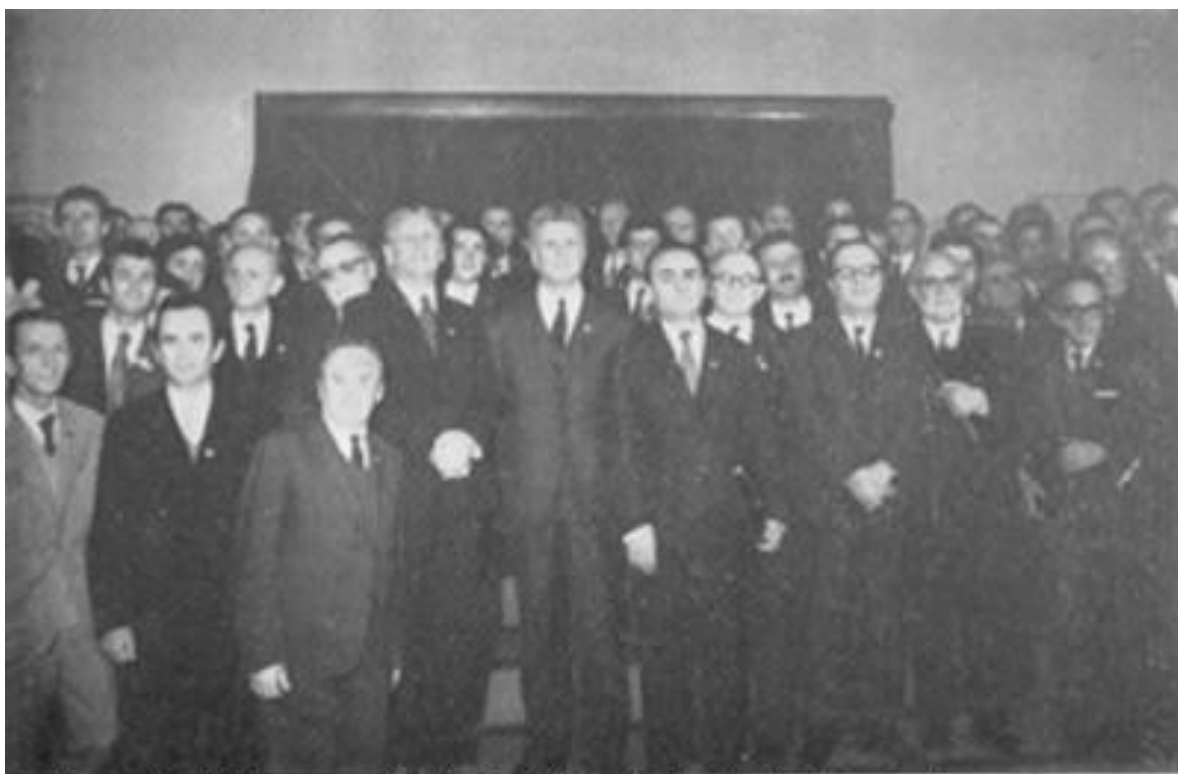
Delegatë të Kongresit të drejtshkrimit të gjuhës shqipe